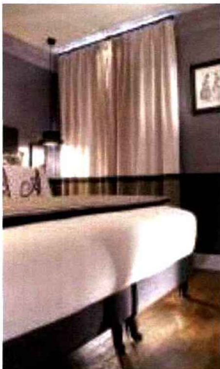
Le lit de la chambre George et Alfred porte des talons hauts.

dans le style de l'époque, ou des acrostiches reproduits en bandeau au plafond. Enfin, dans la chambre