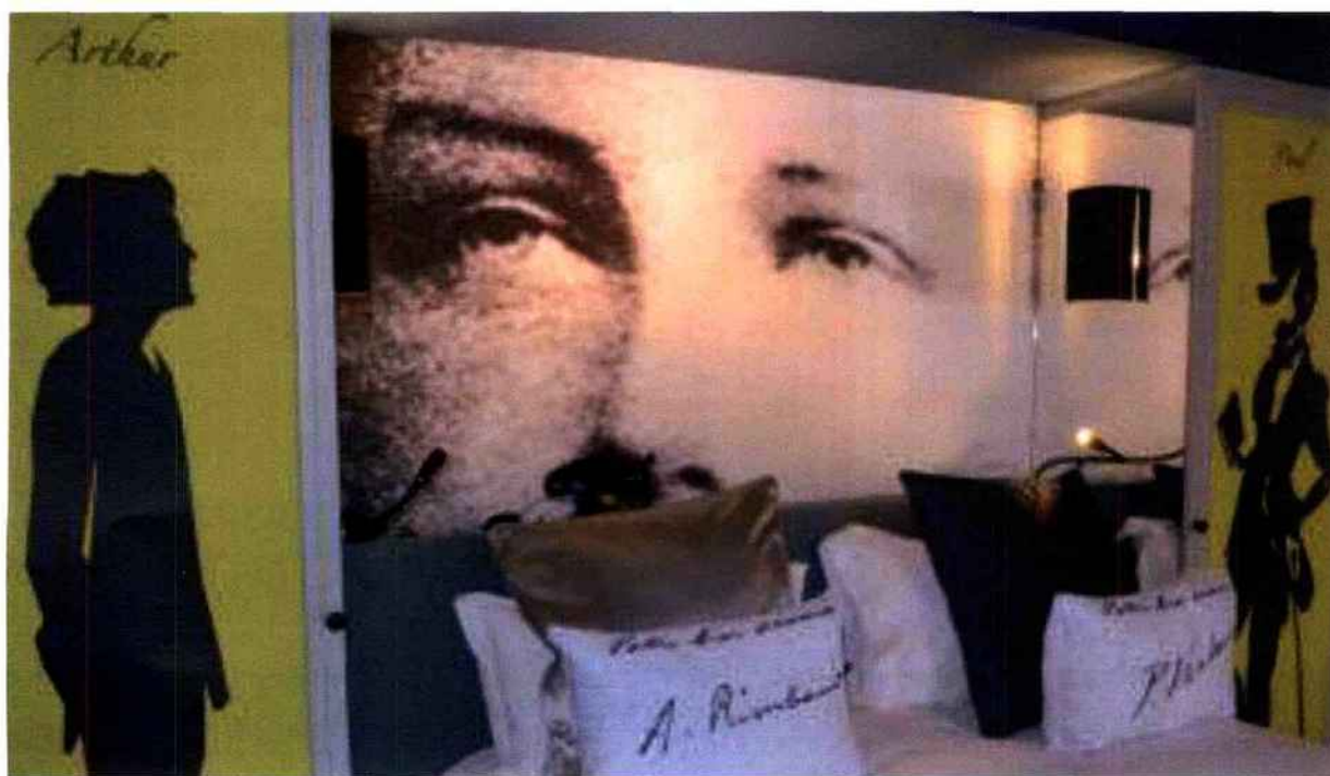
La chambre Paul et Arthur, hommage à Verlaine et Rimbaud.