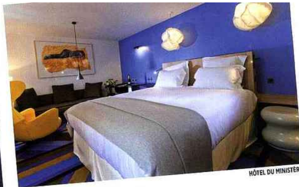
HÔTEL DU MINISTÈRE