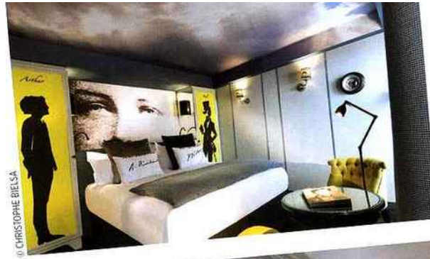
HÔTEL LES PLUMES