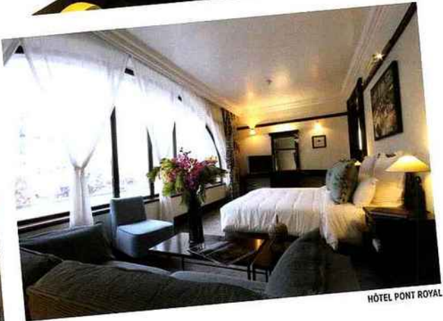
HÔTEL PONT ROYAL