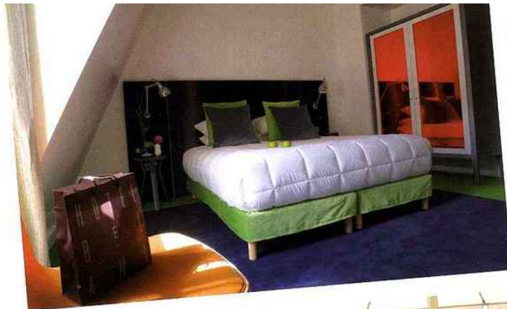
HÔTEL BEL AMI